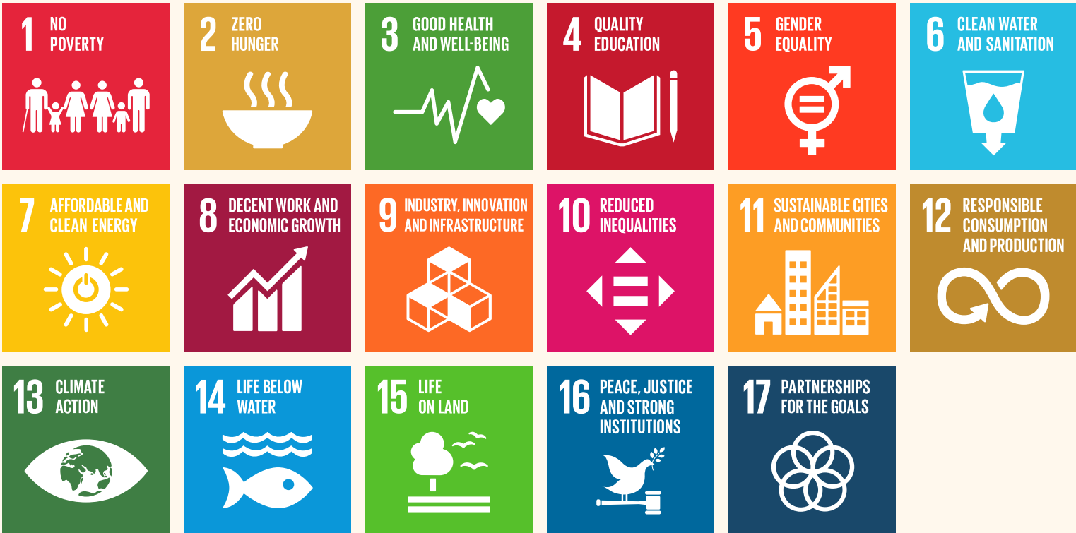
Les 17 objectifs de développement durable :

Ainsi, ce rapport ne se limite pas à un simple bilan, mais témoigne de l'engagement continu du Pays de Fontainebleau pour construire un avenir plus durable, à la fois respectueux de l'environnement et soucieux du bien-être de ses citoyens.